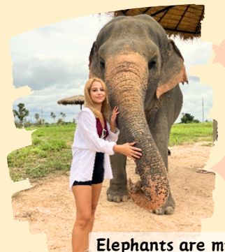
Elephants are my favorite animals!