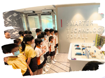
學生在Lenovo科技公司中 認識最新物聯網應用。