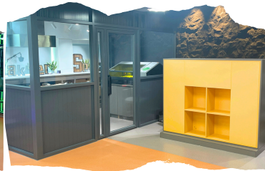
比賽區、教師準備區及雷射切割區分區清晰。