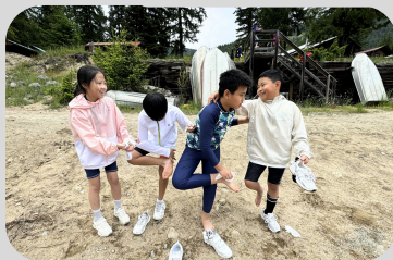
We hated having sand stuck on our feet after kayaking!