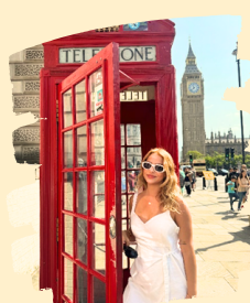
Me from recent trip to London!