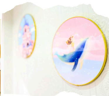
女生洗手間牆壁的海洋裝飾