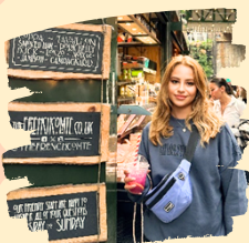
I like visiting food markets!

I am so excited to start teaching, and I look forward to a great year together!