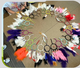
We put our dreamcatchers together to form a circle.