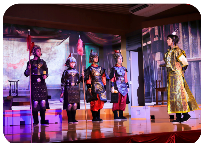
畢業生們獻上精彩的三國演義話劇表演。