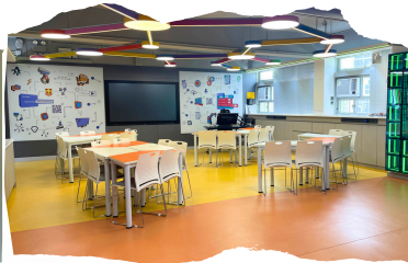
上課區及比賽區有足夠空間讓學生進行學習活動。