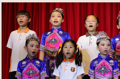
投入演出的低小合唱團成員