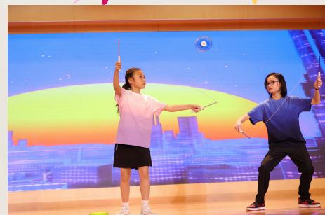
緊張刺激的扯鈴組表演