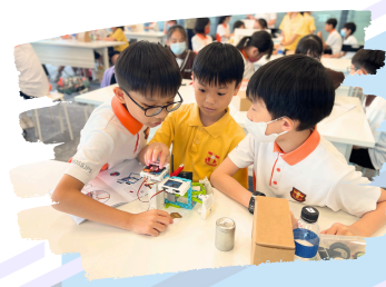
學生正在嘗試讓A.I.協助人類分類。