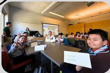
Look! We were making our own nametags.