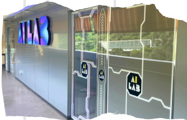
全新的AI Lab本年度正式啟用。

整個電腦室運用了不少智能家居的設備，方便學生與教師上課，讓學生在舒適的空間進行學習及編程，它不僅為學生提供了便利的電腦使用環境，也成為了師生交流與協作的重要場所。