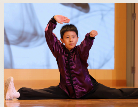
威風凜凜的武術隊師兄全神貫注地表演