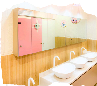
柔和顏色的女生洗手間

我們深信，這樣的環境不僅能改善孩子們的日常使用體驗，更能培養他們對衛生習慣的重視。有了這個全新的洗手間，小學生活將變得更加美好，讓我們一起攜手，為孩子們的健康成長創造更優質的學習環境！