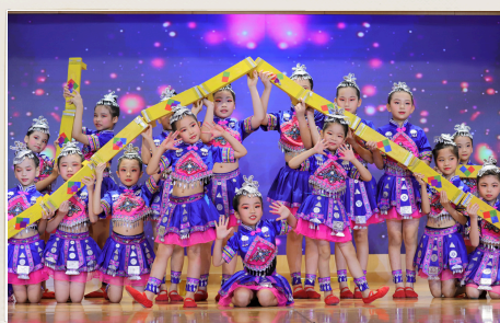
獲得校際舞蹈節優等獎的低小舞蹈組表演