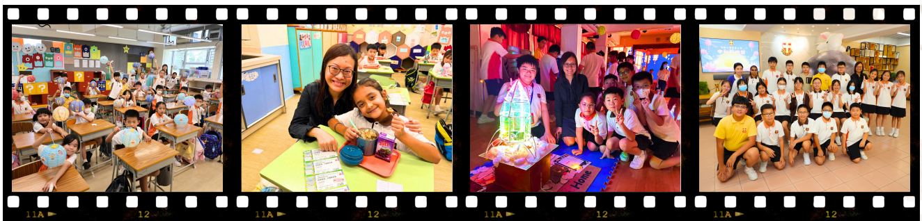
學生努力製作花燈， 一同慶祝中秋節。

本校一直積極宣揚中華傳統文化，六年級學生於較早前參與中文、常識、視覺藝術及電腦科的跨學科活動，創作出獨一無二的紮作燈籠及詩作。本校於活動當天把禮堂佈置成充滿中秋節特色的賞燈會，讓學生在場內展示成品，全校同學及老師、家長均能見證他們的成果，反應非常熱烈。