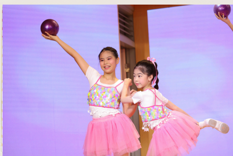
活力四射的藝術體操表演