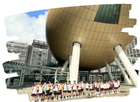
四年級到科學園進行參觀活動。

小四學生於六月二十四日進行了A.I.體驗營活動，內容包括到訪Lenovo科技公司，參觀Lenovo最新展廳及物聯網於現時工業的應用。展廳展示出超級市場應用最新的科技，包括自助販賣系統、智能標籤、智能點貨及由電腦協助刪劃銷售方法等，讓學生緊貼現時最新科技。現場有一個工業物聯網模型，模擬最新無人工業設施是如何運作。