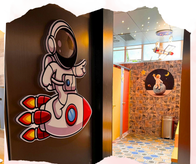
男生洗手間門外的小太空人