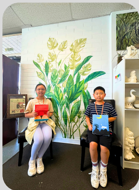
We were happy with our art pieces!

I think the TRU Canada Culture and English summer camp is a very rewarding program for our students. Throughout the program, students gained exposure to Canadian cultures through attending field trips at local museums, taking language courses at Thompson River University and participating in other cultural immersion activities. From Canadian Outdoor Adventure to making dream catchers, students were eager to share their thoughts in English with the locals and their peers, which was a rare sight to me in a Hong Kong language classroom. Besides, language immersion and a positive cultural exchange were satisfactorily achieved through staying with a local host family for 14 days. I would highly recommend all of you to step out of your comfort zone and seize the opportunity to apply for the study abroad program offered by our school in the near future.