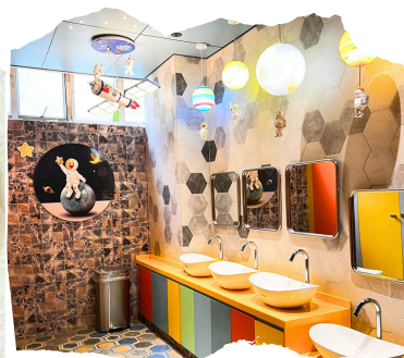
男生洗手間以太空為主題