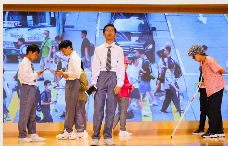
合作無間的中文話劇組表演

表演的學生均施展渾身解數，投入演出。感謝所有全心全意表演的學生及負責訓練的教師，讓是次表演活動得以順利舉行，並在一片掌聲及歡呼聲中劃上完美的句號。