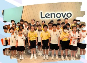
學生到Lenovo科技公司參觀。

另外學生亦親自動手組裝垃圾分類器，亦需教導電腦學習如何分類，學生在專業的導師下能完成簡單的A.I.辨識機械人，亦能從中學習及運用A.I.原理。本次的體驗營可以讓學生走出學校，擴大學生的視野，了解現今的A.I.科技的發展及應用，開拓他們的思維，培養跨文化交流和理解的能力。