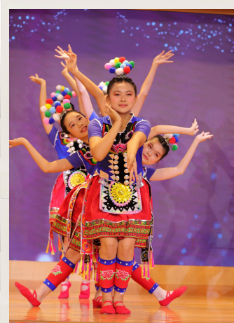
獲得校際舞蹈節甲級獎的高小舞蹈組表演

當天，本校不同組別均預備了精彩的表演節目予家長觀賞，包括分別於校際舞蹈節獲得優等獎及甲級獎的低小及高小舞蹈組表演、於香港國際手鈴奧林匹克比賽獲得金獎的手鐘隊表演、於香港學校戲劇節中榮獲傑出舞台效果獎、傑出合作獎及傑出整體演出獎的中文話劇組表演、於校外獲得多個獎項的體操組韓流舞、爵士舞及現代舞表演、於公開比賽獲得多個獎項的中國武術隊表演及花式跳繩隊表演。另外亦有口琴表演、合唱團表演、英文話劇表演、扯鈴雜耍表演，以及參加了由康樂及文化事務署及劍心粵劇團合辦之『遊藝梨園樂』粵劇實踐計劃的粵劇組表演。