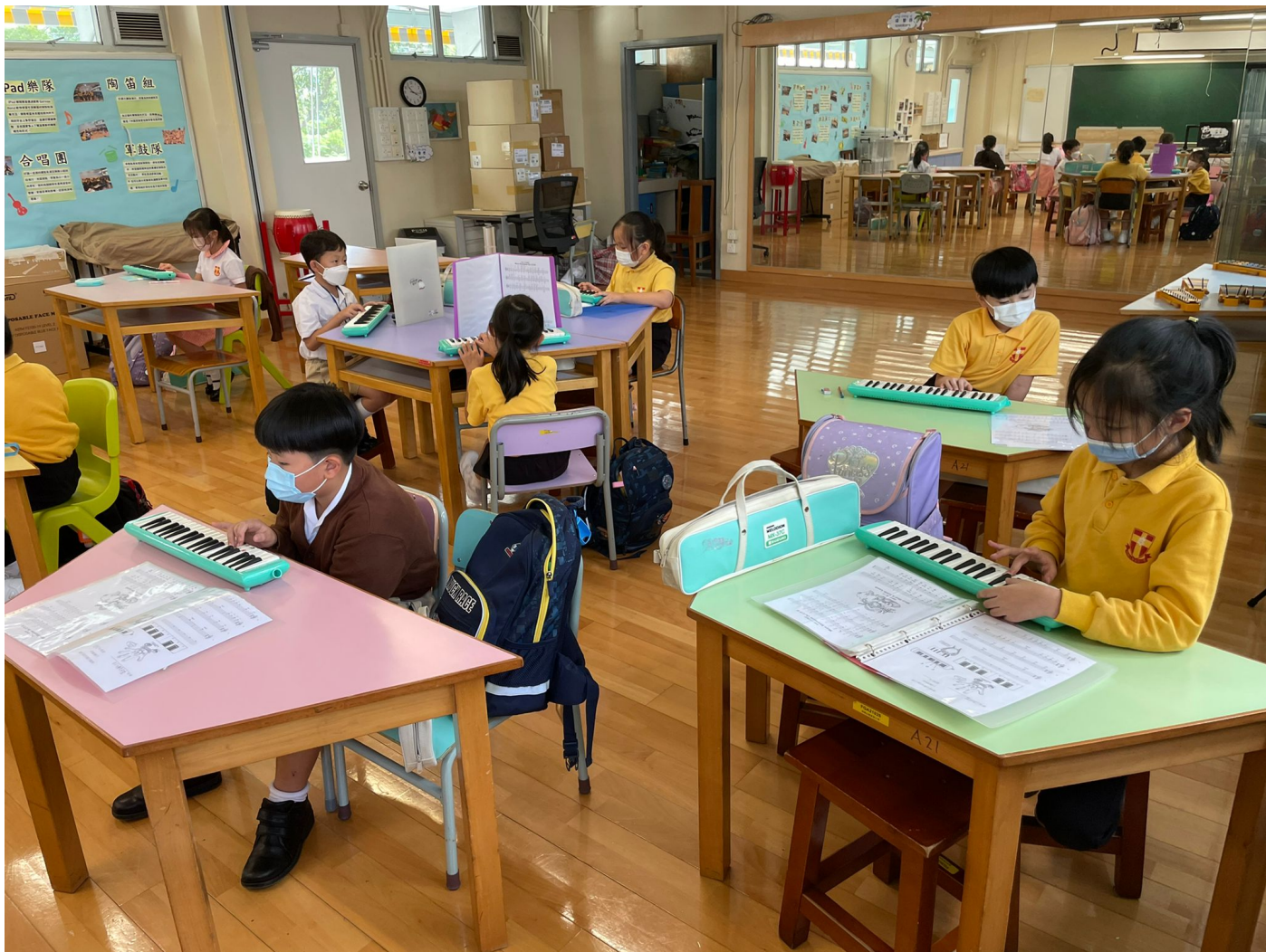
大家都十分認真練習呢！