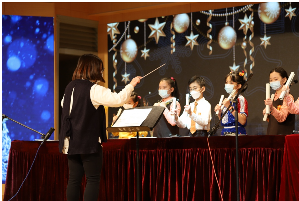
手鐘隊於「聖誕佳音處處聞」活動中演奏聖誕樂曲。