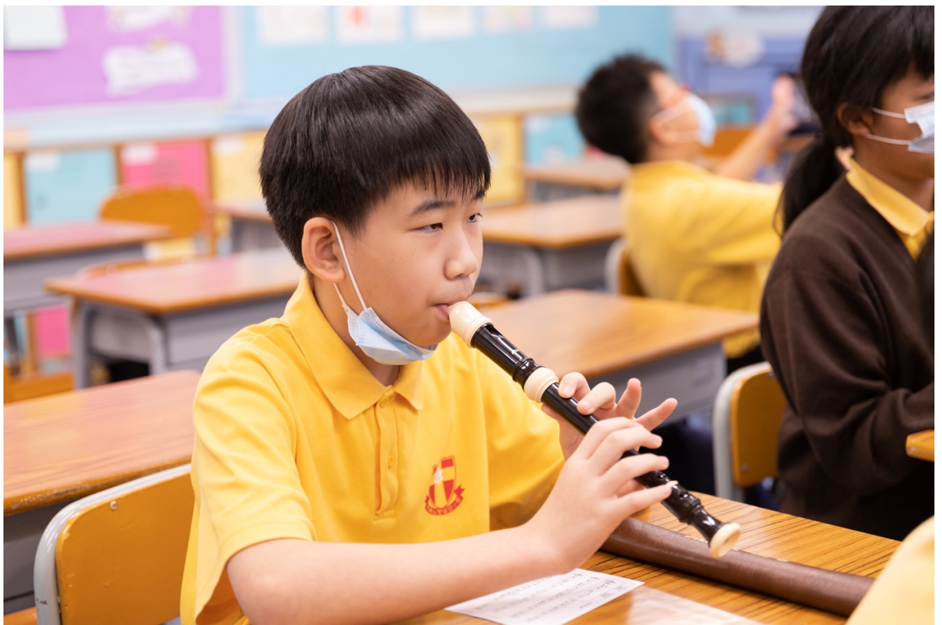
同學進行牧笛獨奏