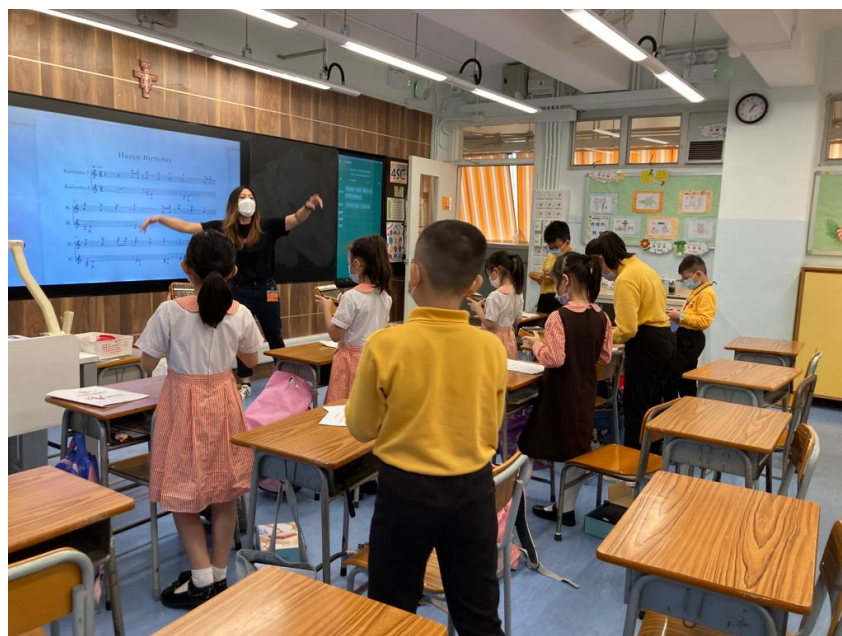
導師教導同學如何演奏