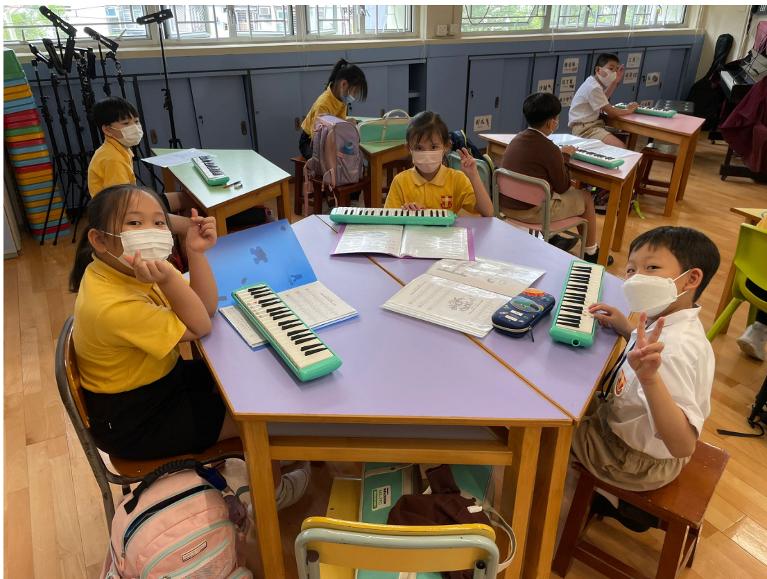
我們喜歡分組練習。