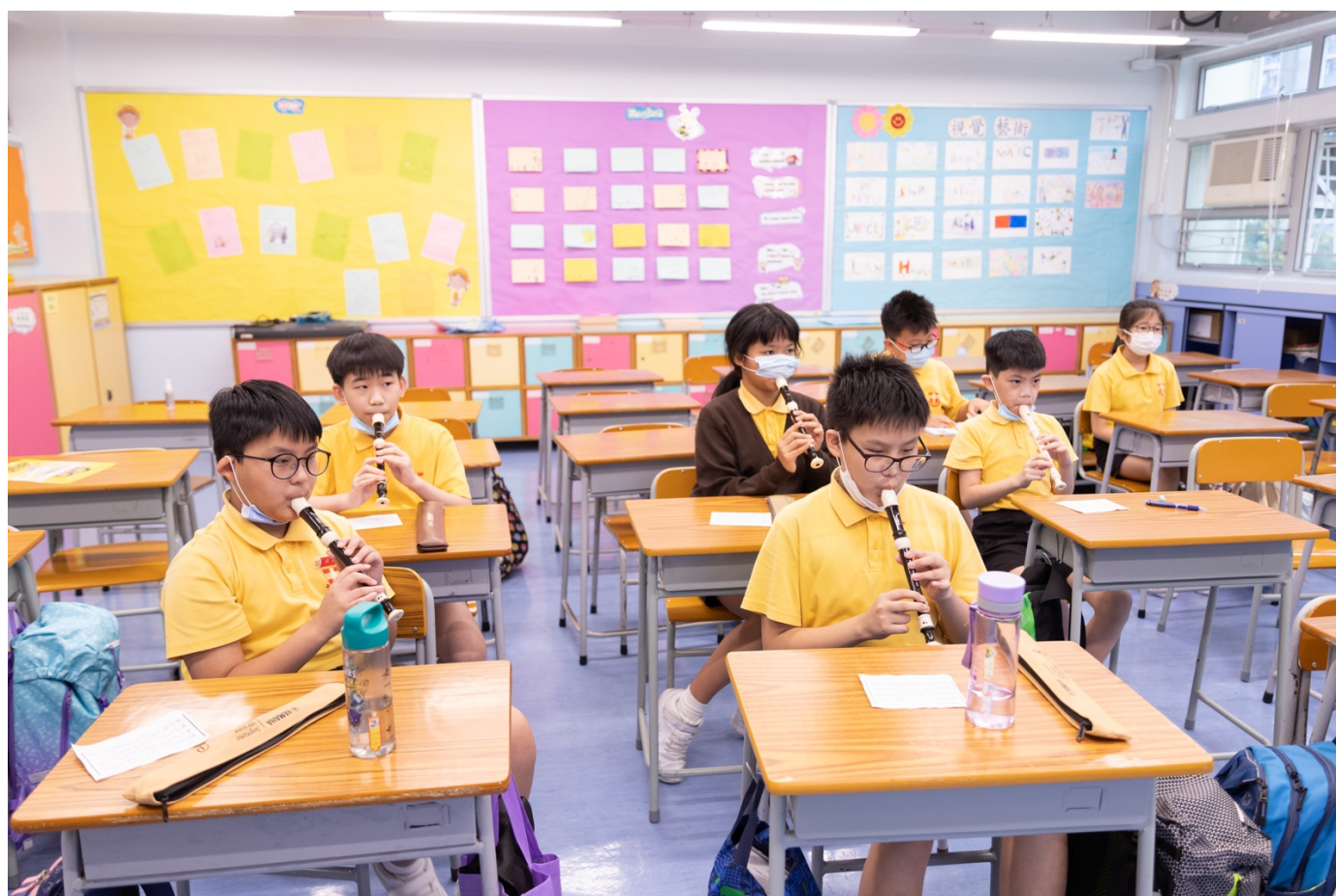
同學們投入牧笛合奏

為提高學生對音樂的鑑賞能力及音樂修養，本校於高小開設牧笛隊，學生利用牧笛進行合奏，從中培養團隊合作精神。此外，學生從中學習基本音樂知識、讀譜能力及演奏能力，培養對吹奏木笛的興趣。