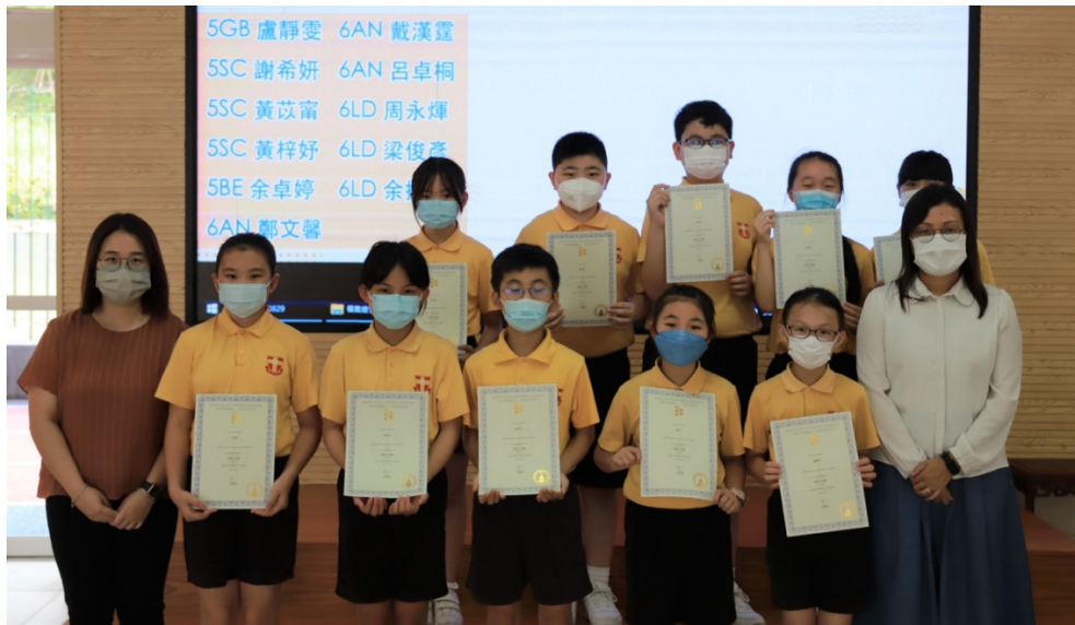
手鐘隊獲得香港手鈴奧林匹克 2022 銀獎。