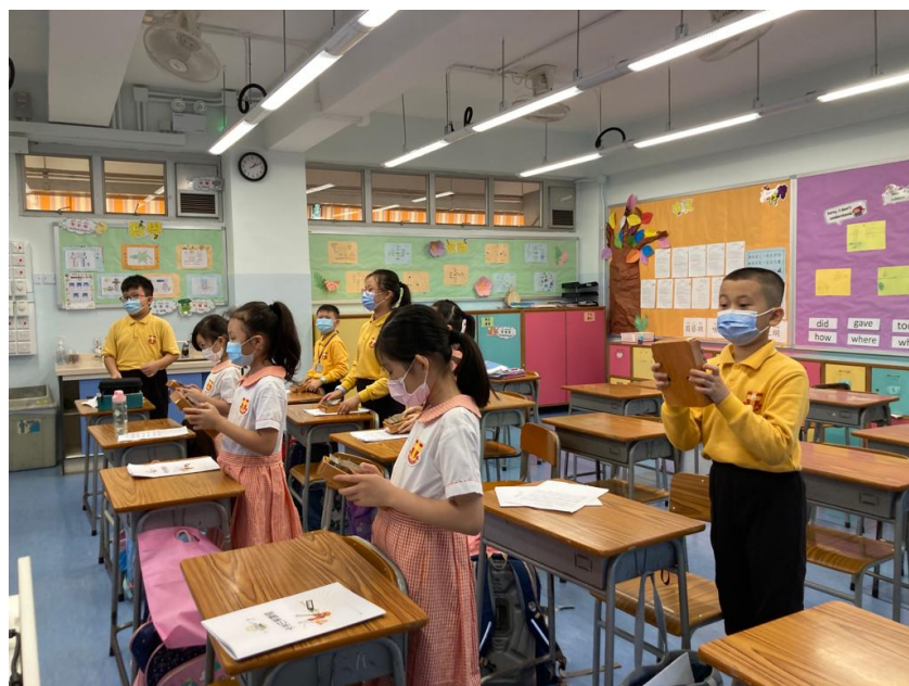
同學合力彈奏樂曲

為提高學生對音樂的鑑賞能力及音樂修養，本校開設拇指琴班，學生利用拇指琴進行合奏，從中培養團隊合作精神。此外，學生從中學習基本音樂知識、讀譜能力及演奏能力，培養對彈奏拇指琴的興趣。