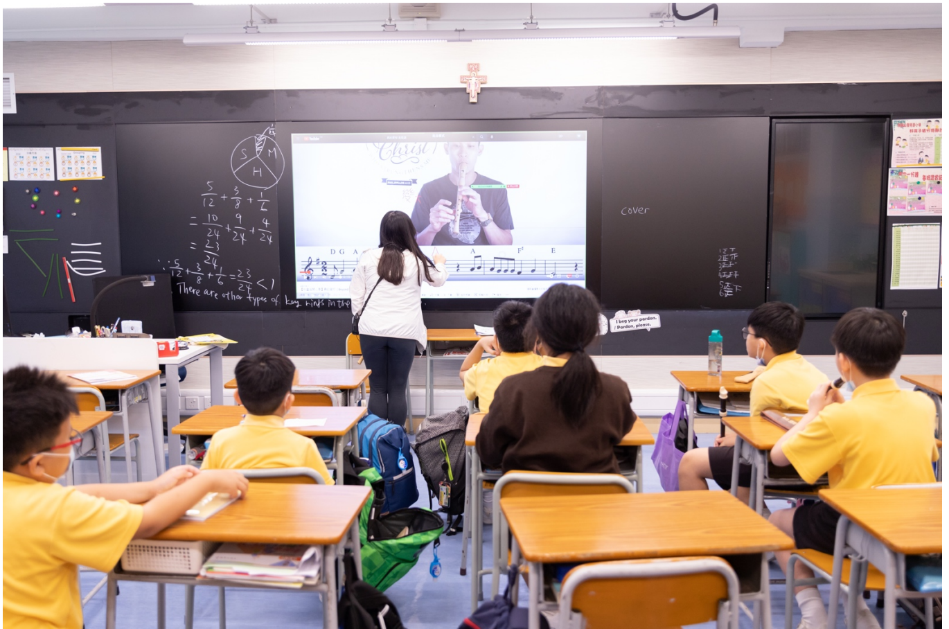
同學們專心聆聽老師傳授基本樂理知識