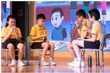
英文話劇演員合力演出「The Chocolate Touch」一劇。

本年度「體藝樂韻頌親恩」表演活動已於 2022 年 7 月 22 日（星期五）於本校禮堂順利舉行。本校不同組別均預備了精彩的表演節目予家長們觀賞，包括武術表演、合唱團表演、體操表演、花式跳繩表演、英文話劇表演，還有萬眾期待的原創音樂劇《我是誰？》。是次節目非常精彩，表演學生均施展渾身解數，投入演出，吸引逾 400 名家長到校或於網上直播觀賞。感謝所有表演學生及訓練教師的付出，令是次表演活動得以順利舉行，並在一片掌聲及歡呼聲中劃上完美的句號。