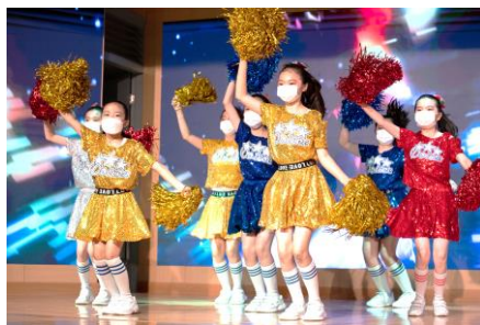
體操隊隊員跟隨音樂的節拍舞動身體。