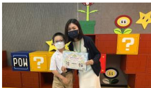
學生代表向老師送上感謝狀。