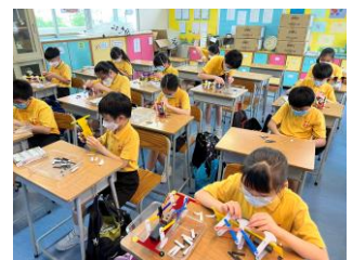
學生專注地組裝機械人。