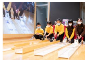
學生們正在進行分組比賽。

本年度常識科會繼續參與由優質教育基金「主題網絡計劃」舉辦的 STEM 學習活動，透過拼砌機械人活動促進高小 STEM 教育。四年級至六年級學生會在課堂之中製作各式各樣的機械人，他們要在製作過程當中組裝各種轉速的齒輪箱、機械人的腳、電池箱及自行接駁電線。學生在經過不斷的測試及改良後，需要與其他學生的機械人進行比賽，過程緊張刺激。而在學習過程中亦需要結合其他學科知識，以及學會遇到困難時主動找教師幫忙或在網上尋求解決方法，藉以提升他們的自主學習能力。