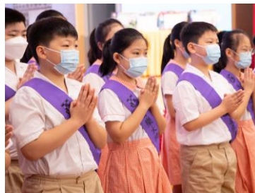
音樂大使以手語帶領學生們頌唱天主經。