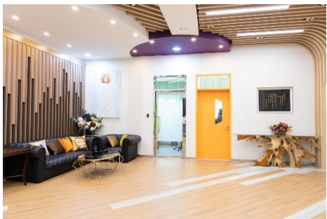
新禮堂大廳設計時尚簡約，充滿濃厚的宗教氛圍。