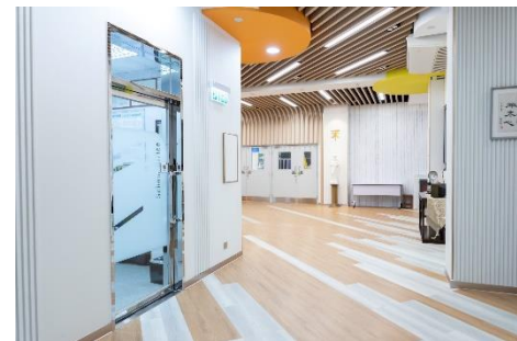
新禮堂大廳空間寬敞，十分舒適。