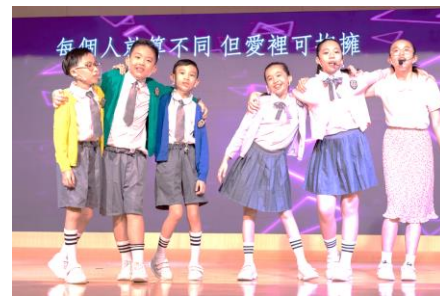
音樂劇演員在臺上載歌載舞，場面感人。