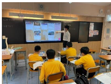
學生於 Padlet 分享，並互相評分。