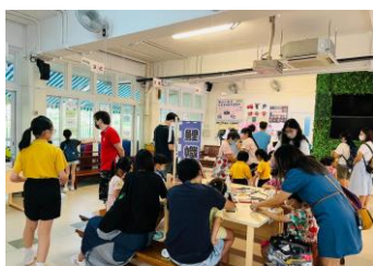
家長和學生們投入製作日式鯉魚旗。