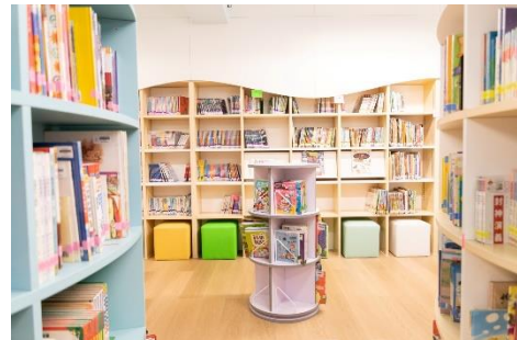
新圖書館使用了時尚簡約的設計，並配以柔光色彩作主調，為學生營造良好的閱讀環境。