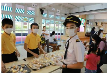
學生們享用英式鬆餅。

學生和家長都表示很喜愛這幾個遊學團。將來當疫情退卻，我們還會考慮繼續遊學活動，讓更多學生放眼世界，增廣見聞。