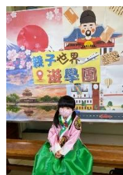
學生身穿漂亮韓服，拍照留影。