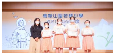
楊校長為學生頒發操行獎。