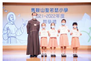
楊修士為學生頒發宗教獎。