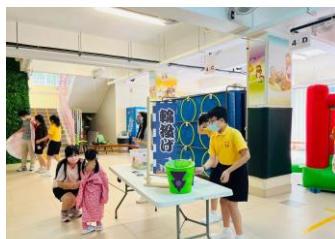
學生們踴躍參與日本文化攤位。