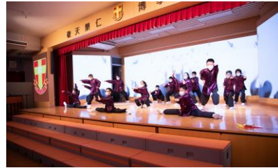
武術隊隊員認真參與表演，大展身手。