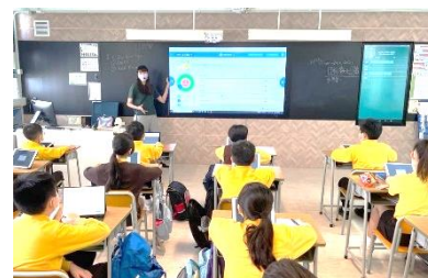
教師即時回饋學生的 Nearpod 課堂活動表現。