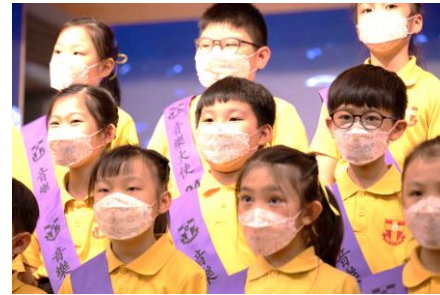
合唱團的歌聲繞樑三日，一同用歌聲歌頌天主。