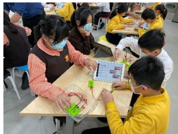
分組進行科學實驗和探究活動，並使用 iPad 紀錄數據。