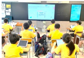
使用 iPad 做堂課，每位學生都積極回答問題。