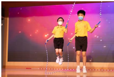
跳繩隊隊員互相配合，跳出不同難度的花式。