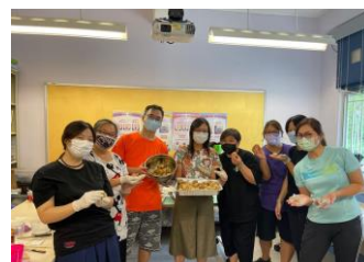
校長、教職員和家長義工一同製作北京糖火燒餅。