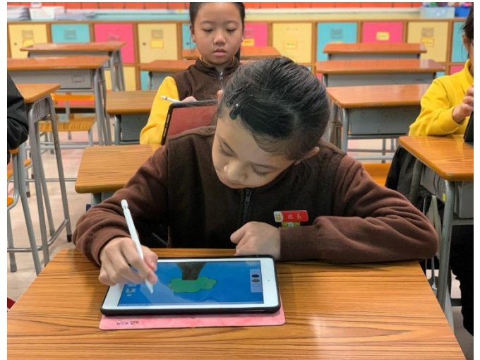
高年級小組成員於課堂上利用平板電腦內的繪圖軟件學習基本的繪圖技巧。