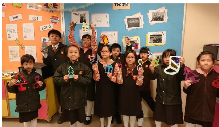
我們是小小藝術家。