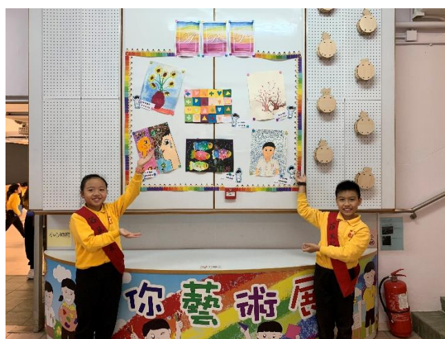
我們也幫忙佈置藝術展區呢！