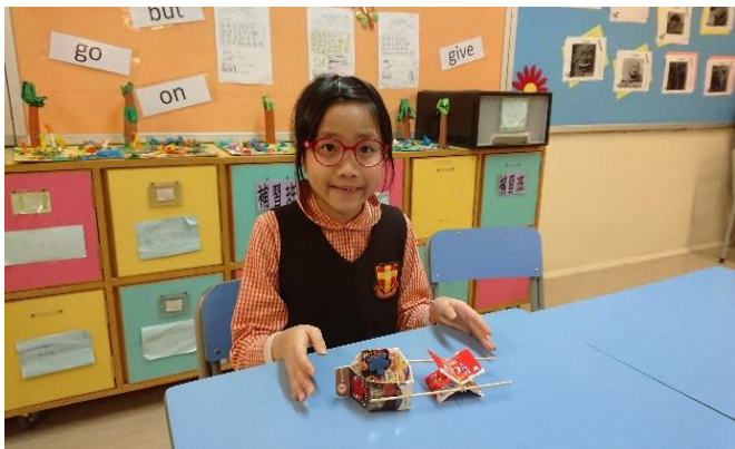
花點心思，牛奶盒變身成漂亮的動力船。