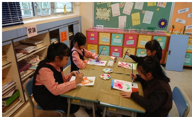
低年級同學運用廣告彩製造漸變效果。