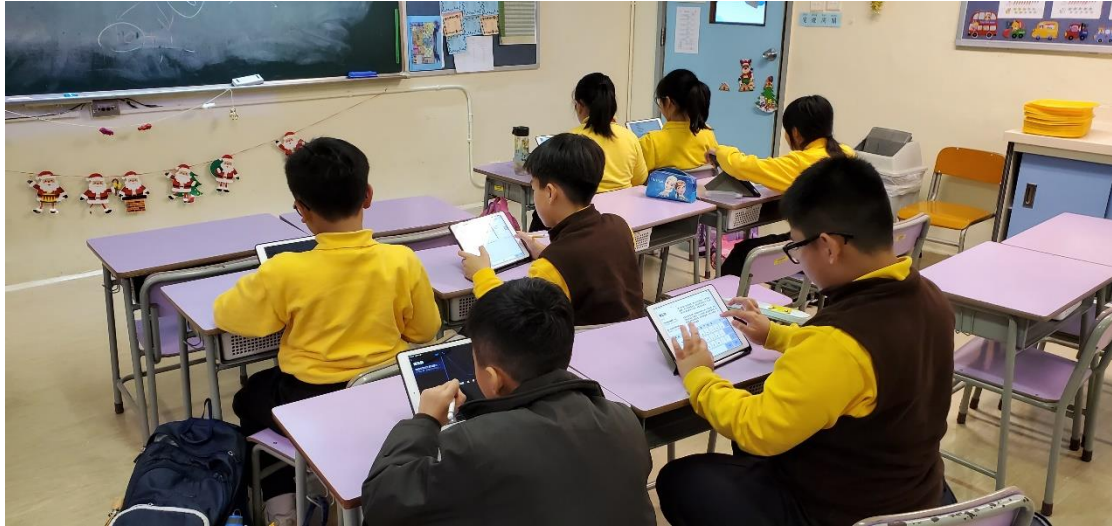
學生在課堂上利用平板電腦搜集資料和建構寫作大綱。