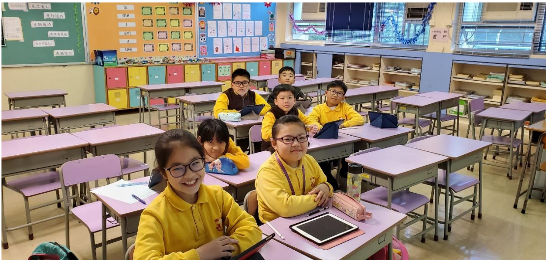
寫作拔尖班 B 組合照

中文寫作拔尖班透過靈活互動的學習模式，發掘學生對於寫作的潛能和興趣。課堂鼓勵學生融合傳統寫作和電子學習的互通，啟發學生的創作靈感，穩固其寫作基礎和涵養。此外，寫作拔尖班亦提供機會予學生參加不同類型的寫作比賽，藉此拓展學生的眼界和寫作信心，啟迪其學習語文的興趣。