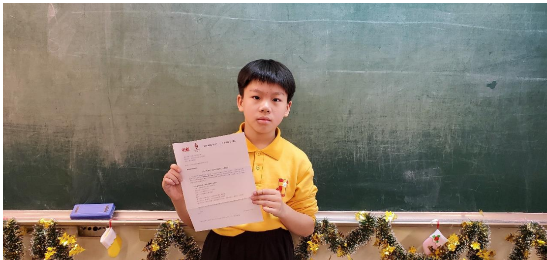
學生獲選參與由《明報》和語常會聯辦的「小作家培訓計劃」。