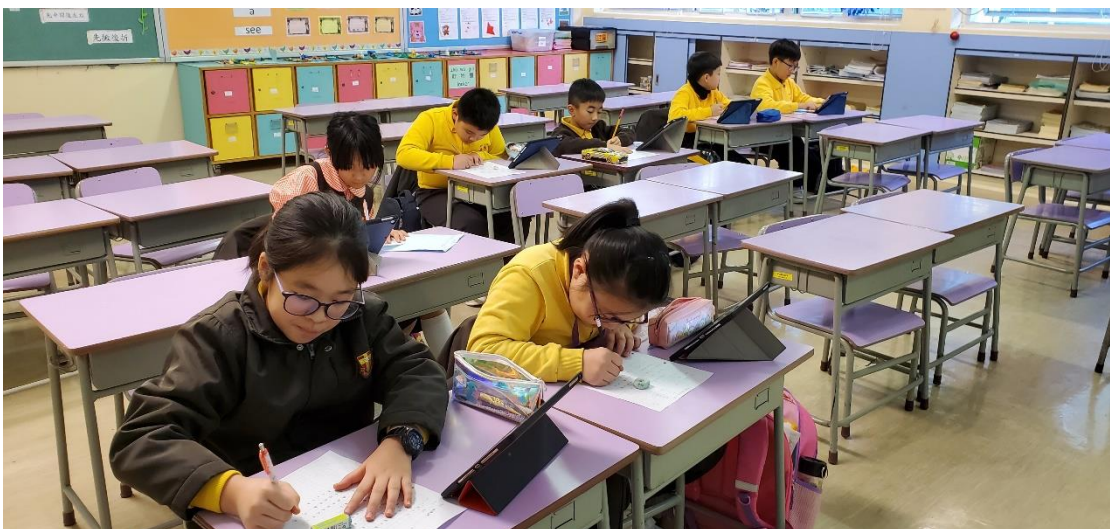
學生通過書寫文章，提升寫作能力和自信。