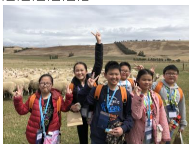
The sheep are coming!