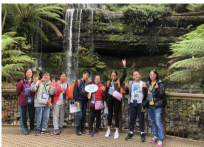
Mount Field National Park is awesome.

After the study tour, students felt more confident in speaking English through interviewing people in Australia, including the cruise captain. They also shared their experiences with each other, communicating in English with their schoolmates. Tour participants are now well prepared to further share this knowledge with their schoolmates and families, with the aim of raising environmental awareness in Hong Kong.