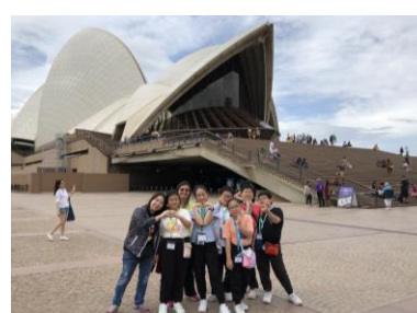
We meet "shells" - Sydney Opera House.