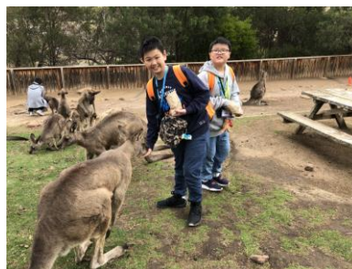
Feeding kangaroos is really fun.