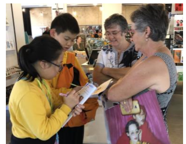
We are interviewing some Australians.