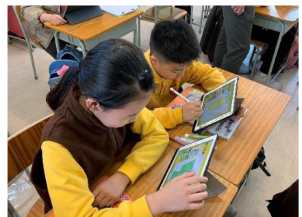
學生於課堂中使用平板電腦進行活動。