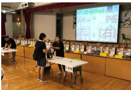
於學期初派發於 7 月訂購的平板電腦。

提升學生的資訊素養，促進學生有效地使用資訊的相關能力及態度，尋找、評鑑、提取、整理和表達訊息。