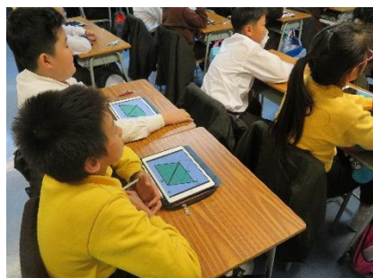
學生在課堂展示在平板電腦的預習及進行討論。