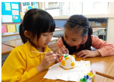
我們正為小豬塗上顏色呢！