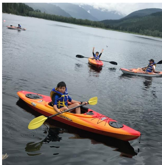
Look at me paddling my kayak!