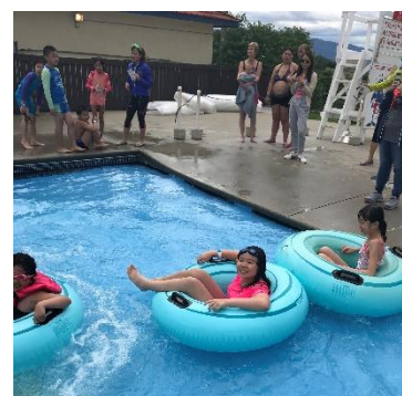
Exciting waterslides! Love it!