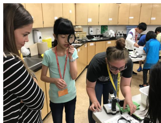
We observed the larvae in the science experiments.