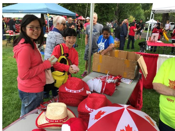
Let's celebrate Canada Day together!