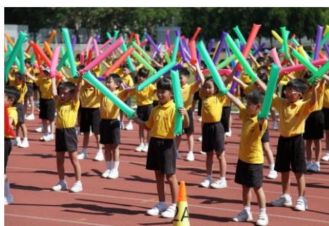
同學們正在運動場上合力表演集體舞。