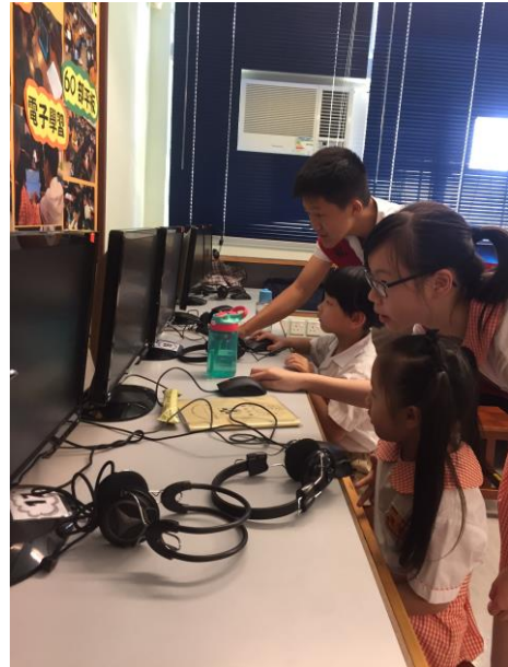
普通話大使指導低年級的學生透過「來說普通話電子學習平台」來自學普通話。