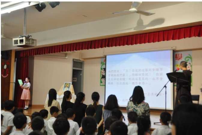
大家專心聆聽天主聖言。