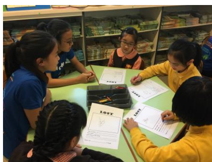
We are writing about the characters in the story!