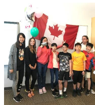
Thanks to our teachers!