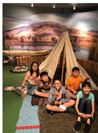
A tent in the museum!