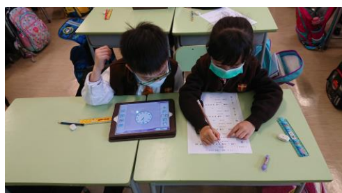
學生正透過平板電腦進行數學探究活動。