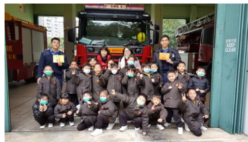
參觀馬鞍山消防局。