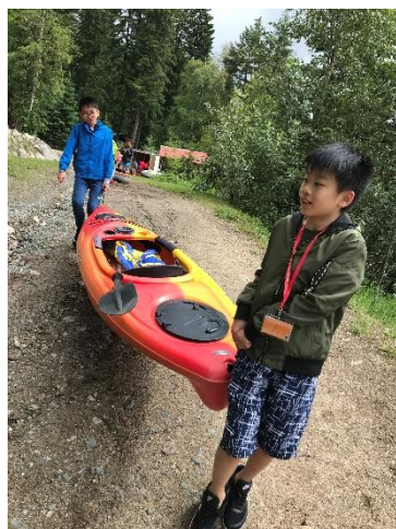
We were getting our kayak!