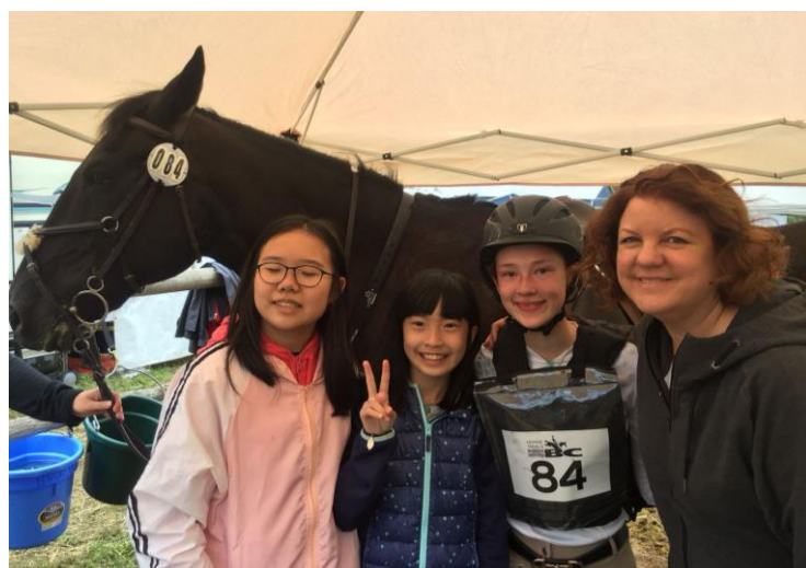
Horse riding with the host family.