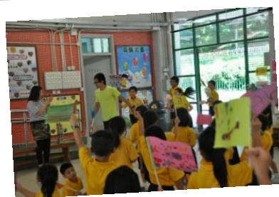
運動員回來了!全校歡呼迎接!