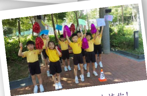
加油，努力!我們支持你!

我們沿途劃分了六個分站，在體育老師的帶領下，一至六年級的男女健兒依次以接力的方式，將每站代表五年標誌(1987-1992、