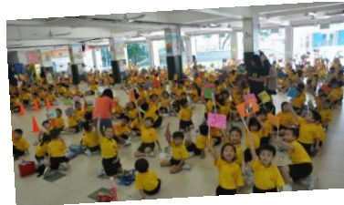
啦啦隊們落力地吶喊：「加油!加油!」

到了最後一站，當六年級的大哥哥和大姐姐把火炬傳送到學校時，全體師生均興奮地揮動著自行設計的啦啦隊旗幟歡迎他們，整個活動在一片歡呼聲中完滿結束。