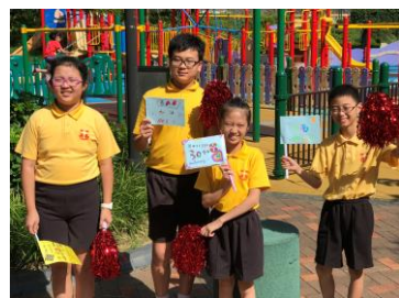
馬鞍山聖若瑟小學，HAPPY BIRTHDAY!

到了最後一站，當六年級的大哥哥和大姐姐把火炬傳送到學校時，全體師生均興奮地揮動著自行設計的啦啦隊旗幟歡迎他們，整個活動在一片歡呼聲中完滿結束。