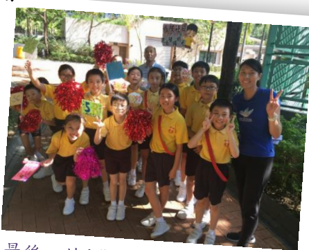
最後一棒!學校踏入第30年啦!

我們沿途劃分了六個分站，在體育老師的帶領下，一至六年級的男女健兒依次以接力的方式，將每站代表五年標誌(1987-1992、